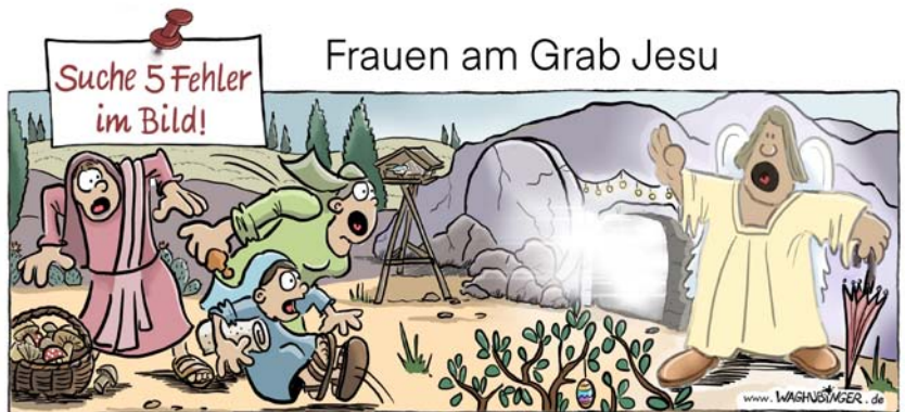
Korb mit Pilzen, Osterhaus, Vogelhaus, Lichterkette, Regenschirm